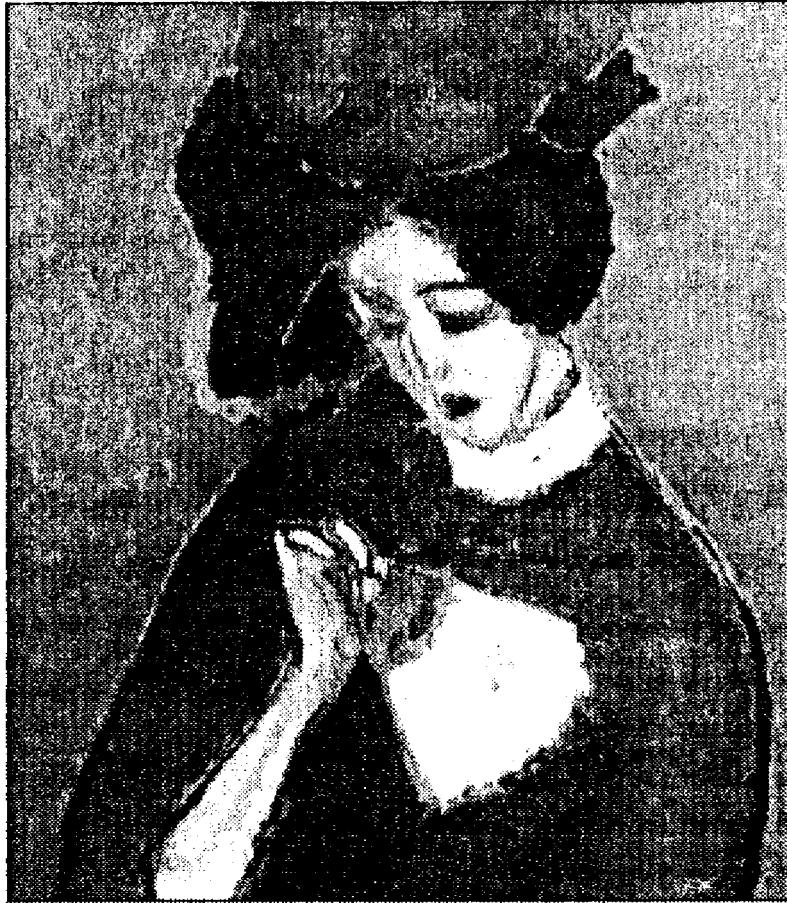
Mujer con abanico (1909), de Alexei Jawlensky.

FUNDACIÓN JUAN MARCH. Castelló, 77. Tel. 435 42 40. Hasta el 14 de junio